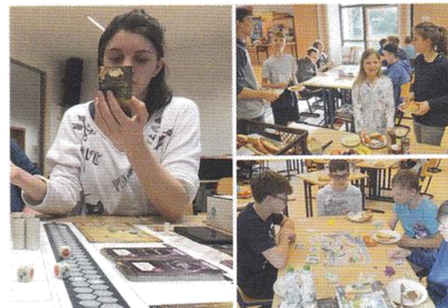
05:30 Uhr– welch ungastliche Zeit für TIME Stories ...