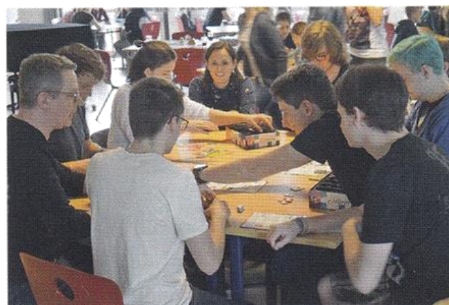
Wer ist bei „NMBR9“ obenauf?