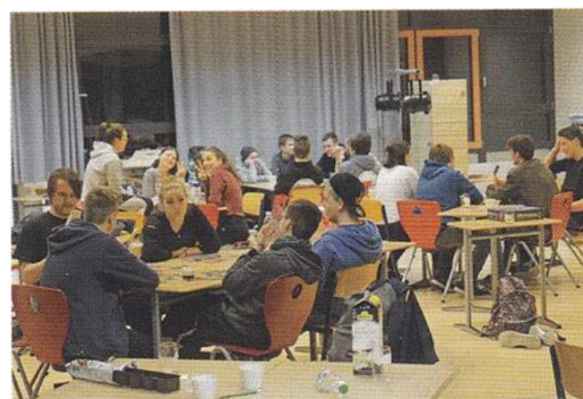
Morgens um halb drei in Bönningheim ...