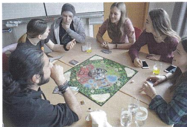
Lieber „Castle Panic“ als Abistress!